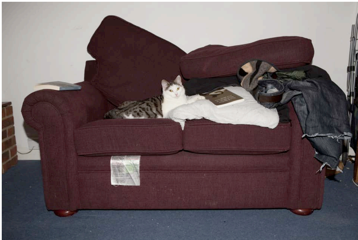
Edmund Clark, aus der Serie Control Order House , 2011